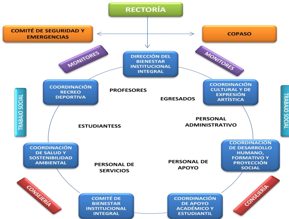
Figura 6. Análisis conceptual del micro-entorno Referido a las dimensiones de bienestar