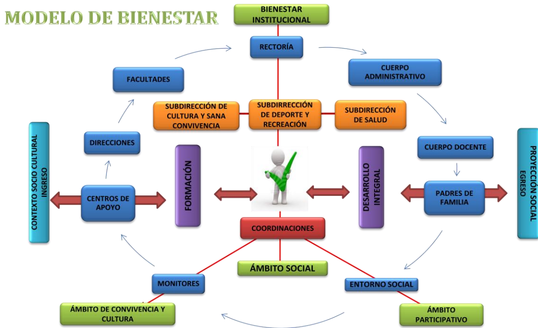
Figura .5. Análisis conceptual del micro-entorno Referido a las dimensiones de bienestar

En el cumplimiento de estas consideraciones se expidió la Resolución Rectoral No 017 del 10 de mayo de 2006 que deroga la anterior y reestructura su funcionamiento en una Dirección y tres Subdirecciones: Subdirección de recreación deporte, Subdirección de Cultura y Promoción Socio-Económica y Subdirección de Salud Integral y Desarrollo Humano.