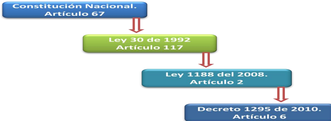
Figura 3. Análisis del meso-entorno del bienestar. Evolución normativa