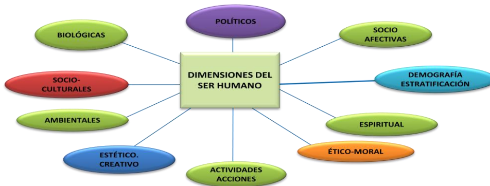
Figura 4. Análisis conceptual del micro-entorno del bienestar. Referido al ser humano

Desde su fundación, la concepción de Bienestar ha hecho referencia a los aspectos necesarios para lograr una óptima calidad de vida, incluyendo el bien-estar, el bien-ser y el bien-hacer, de acuerdo con los principios e ideales planteados en el Proyecto Educativo Libertadores, asumiendo que el bienestar institucional parte del bienestar individual ejercido por la misma esencia del “ser humano” (Figura 4), considerando su integralidad, lo cual supone el desarrollo y perfeccionamiento de la persona durante todo su ciclo de vida institucional, así como un ambiente o medio que lo favorezca que es la razón de ser de las actividades y acciones diferentes de Bienestar Universitario.