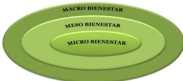
Figura 1. Análisis del entorno del bienestar Universitario institucional

En este análisis se tienen en cuenta los siguientes factores: tecnológicos, demográficos, económicos, políticos, legales, internacionales, ambientales y socioculturales.