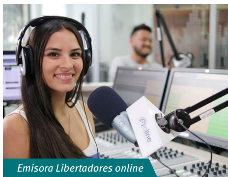
Emisora Libertadores online