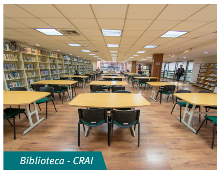
Biblioteca - CRAI