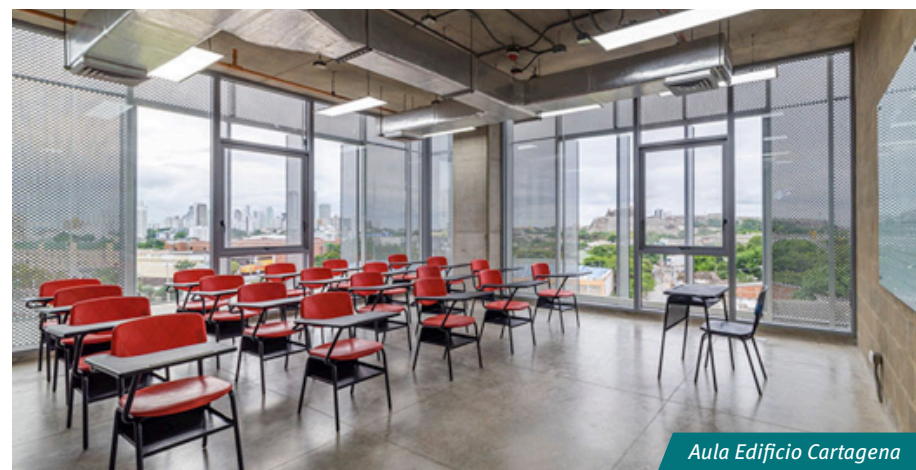
Aula Edificio Cartagena