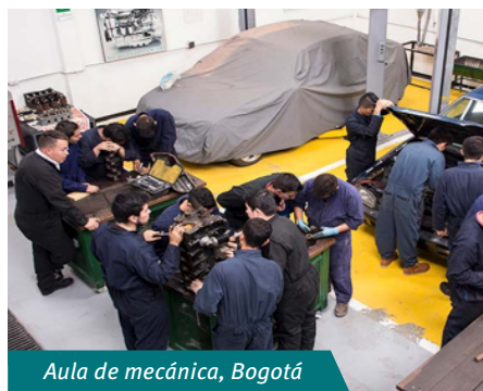
Aula de mecánica, Bogotá