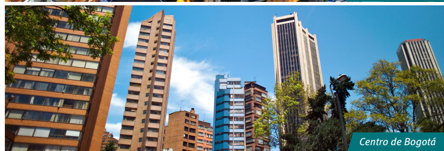
Centro de Bogotá