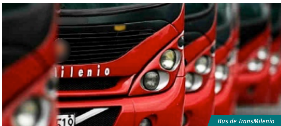
Bus de TransMilenio

Uno de los más usados es el SITP, compuesto por Transmilenio y unos buses especiales de color azul y/o rojo, que conectan a casi todo Bogotá. Cuenta con diferentes estaciones en la ciudad y el costo del pasaje es de $2.400 todo el día, y de $2.200 para los servicios zonales.