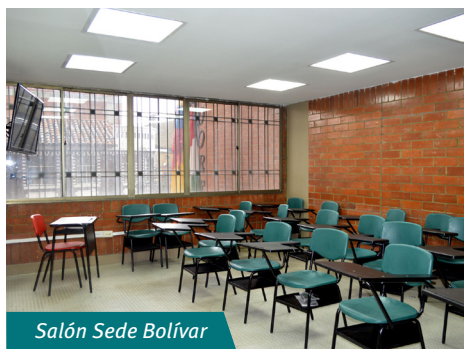
Salón Sede Bolívar

La Universidad Los Libertadores en Bogotá cuenta con una infraestructura de 47.117 metros cuadrados, el espacio principal es en la Carrera 16 # 63a – 68 ya que es el centro de la actividad diaria en la Institución, debido a su ubicación estratégica alberga la mayor cantidad de aulas de clases e incluye una emisora online y aulas de mecánica automotriz. Además de centralizar las actividades académicas, también ha permitido la realización de eventos masivos en la plazoleta y auditorios los cuales han recibido a grandes figuras de la vida pública nacional e internacional.