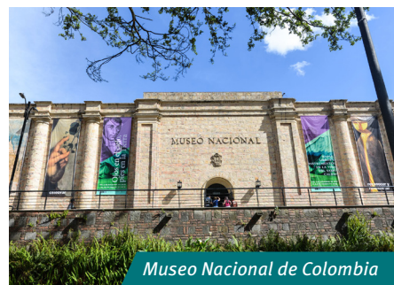
Museo Nacional de Colombia