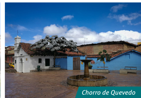
Chorro de Quevedo

Mayor información aquí: http://www.colombia.com/turismo/sitiosturisticos/bogota/