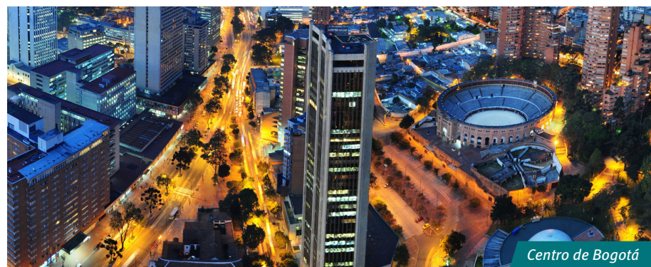
Centro de Bogotá

Es la tercera capital más alta de Sudamérica (después de Quito y La Paz). Está ubicada en el centro de Colombia. Además, es la plataforma empresarial más grande de Colombia en donde ocurren la mayoría de los emprendimientos de alto impacto.