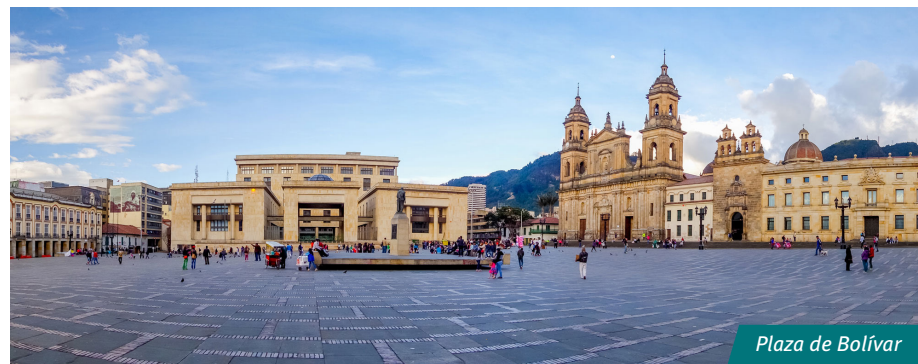
Plaza de Bolívar

El Chorro de Quevedo, un lugar icónico ya que aquí se estableció Gonzalo Jiménez de Quesada antes de fundar la ciudad en el año 1538. Ubicado en el centro histórico de la ciudad, rodeado de construcciones coloniales de principios del siglo XX. Un espacio único, donde ocurren eventos culturales cada semana.