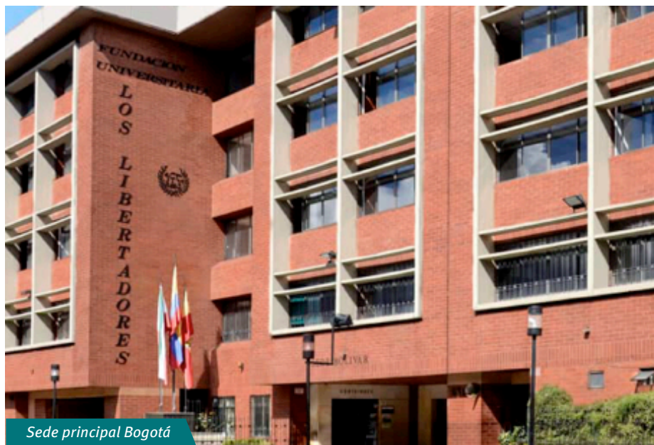
Sede principal Bogotá

Al interior de sus instalaciones cuenta con el centro de recurso para el aprendizaje y la investigación, el laboratorio de hipermedia Hitec, la biblioteca, el área de bienestar universitario y el centro de medios audiovisuales, con estudio de televisión, cabinas de radio y salas de edición.