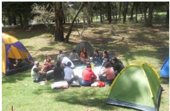
Parque Simón Bolívar localidad Barrios Unidos, Bogotá. Estudiantes de VI semestre de Tecnología en Gestión Turística y Hotelera.