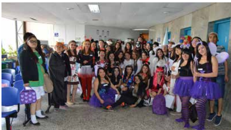
Grupo de Voluntarios. Fiesta de Halloween 31 Octubre 2014. Hospital Kennedy.

Este logro contó con la participación de más de 200 Voluntarios, entre estudiantes, docentes, y personal administrativo y con la generosa donación de alimentos recibidos de parte de toda la Comunidad Libertadora para la elaboración de los refrigerios suministrados a los niños beneficiados. Nuestro programa hizo presencia de manera muy activa en la jornada gracias a las donaciones recibidas por parte de Directivos, Administrativos, Docentes y Estudiantes y con la participación de más de 20 estudiantes que con gran sentido de solidaridad, asistieron a la jornada e interactuaron con los niños y sus familiares. Esto da cuenta de un proceso exitoso en nuestra labor misional de formación de tecnólogos y profesionales con amplio sentido de lo social y permite a los voluntarios construir en forma integral un sentido de vida orientado al bien común. Felicitaciones a nuestros voluntarios.