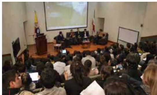
Primer conversatorio de “Experiencias exitosas en el desarrollo comunitario del turismo”. Estudiantes Programa Administración Turística y Hotelera.

Para el 2014 la celebración del Día Mundial del Turismo, cuya fecha oficial es el 27 de Septiembre, aprovechada para divulgar y sensibilizar acerca del valor social, cultural, político y económico del turismo, dedicó el propósito al lema “Turismo y desarrollo comunitario”, campo en donde Colombia ha avanzado de manera destacada viendo la actividad turística como una herramienta para dar oportunidades a nivel local, en donde las personas participan activamente hacia un desarrollo sostenible con el Turismo como el vehículo que lo favorece.