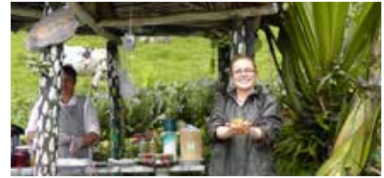
Cascadas "La Chorrera" en Choachí, Cundinamarca (2014) Estudiantes y Docentes Administración Turística y Hotelera Celebración Día Internacional del Turismo.