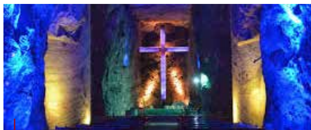
Catedral de Sal de Zipaquirá.

Otras empresas que cabe destacar entre los convenios suscritos son Global Reps., Chivas y viajes por Colombia, Hotel Quinta Paredes Inn, Hoteles Calle 93, Hoteles de la Esperanza, Sociedad Hotelera Cien Internacional, Festival Tours L'Alianza y Sertel.