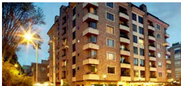
Hotel Suites 101 Park House.