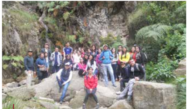
Cascadas Las Delicias, Cerros Orientales en Chapinero, Bogotá. Estudiantes de VI semestre de Tecnología en Gestión Turística y Hotelera.

El mismo grupo desarrolló un Taller de Campamento en el Parque Simón Bolívar en donde aplicaron algunas técnicas necesarias para lograr una relación responsable con el medio ambiente en la actividad de Campismo, logrando algunos objetivos para el grupo como técnicas de supervivencia, montaje de carpas, manejo de nudos, trabajo en equipo, espíritu de solidaridad, fortalecimiento de valores, esfuerzo y superación personal.