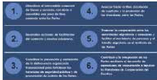
Figura No 1. Acciones de la Alianza del Pacífico.