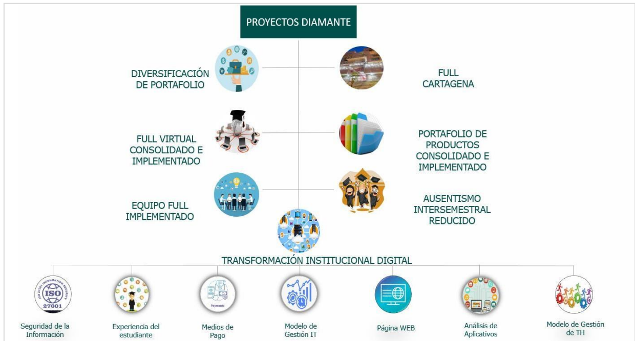
Ilustración 2. Proyectos de Gestión 2021