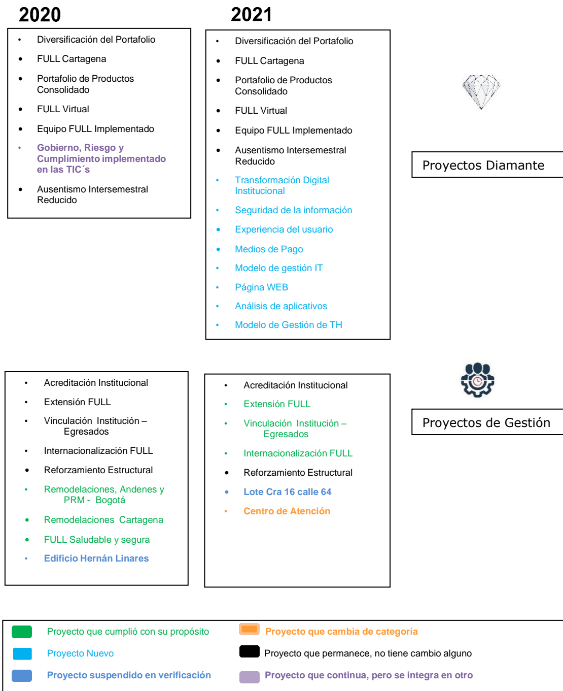
Ilustración 5 Priorización de Proyectos 2020 vs 2021

De acuerdo con la integración estratégica se realizó la revisión y ajuste a la estructura de Nivel de los Proyectos.